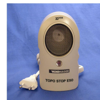
Topo Stop E50

Virransyöttö: 220 V virransyöttö. Taajuus: 30 - 40 kHz 99,5% äänestä on ultraääntä.